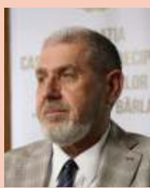
Președinte NICOLAE MIHAI