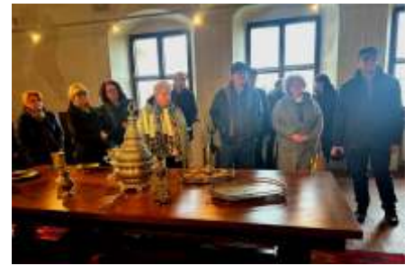
Ședința Consiliului Director al Federației Naționale "Omenia" a Caselor de Ajutor Reciproc ale Pensionarilor din România Târgoviște