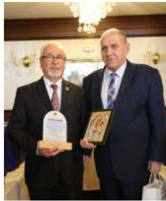
35 de ani de activitate a Federației Naționale "Omenia" a Caselor de Ajutor Reciproc ale Pensionarilor din România Bușteni