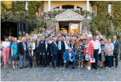
70 de ani de activitate a Casei de Ajutor Reciproc a Pensionarilor Șimleu Silvaniei